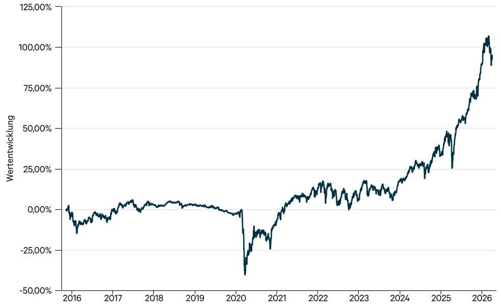
— Ampega Balanced 3 P (a)