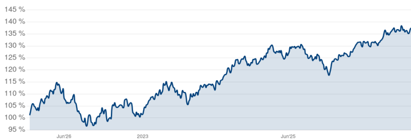
— Frankfurter Modern Value Index